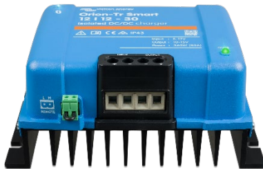
Orion-Tr Smart 12/12-30