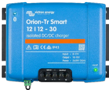
Orion-Tr Smart 12/12-30