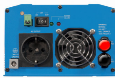
Phoenix Inverter 12/800 with Schuko socket