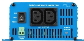
Phoenix Inverter 12/350 with IEC-320 sockets