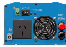
Phoenix Inverter 12/800 with AN/NZS 3112 socket