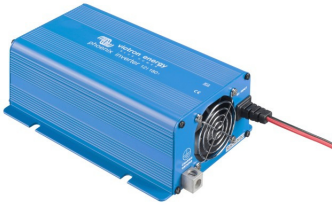
Phoenix Inverter 12/180