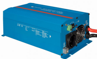
Phoenix Inverter 12/800 with Schuko socket