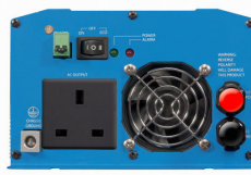
Phoenix Inverter 12/800 with BS 1363 socket