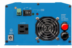
Phoenix Inverter 12/800 with Nema 5-15R socket