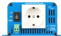
Phoenix Inverter 12/180 with Schuko socket