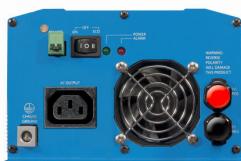
Phoenix Inverter 12/800 with IEC-320 socket