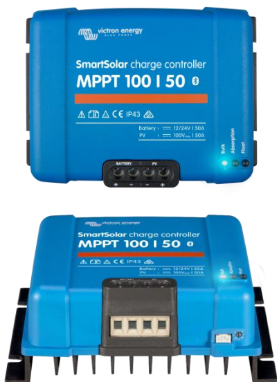
SmartSolar Laadcontroller MPPT 100/50