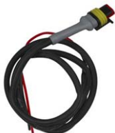
Besturingskabel voor Cyrix-ct 12/24-230 Lengte: 1m